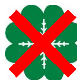
Gammel logo, skal ikke brukes

Vær nøye med å bruke riktig logo og profil – husk at dette er Senterpartiets ansikt utad.