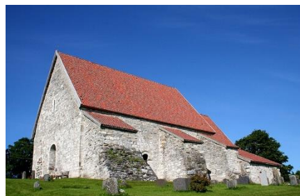
Sakshaug gamle kirke er blant kirkene som har fått tilskudd.

I mai er det mange helligdager, det er vår og tid for konfirmasjoner og andre festligheter. Selv om mai er en travel måned, må vi prøve å være til stede på arrangementer, markedsdager og lignende. Vi kan ta initiativ til en vår-samling, eller markere FNs internasjonale dag for bier den 20. mai som nevnt over. Vi kan som alltid synliggjøre Senterpartiets politikk i leserinnlegg og på sosiale medier. Vær kreative og bruk de gode eksemplene på Senterpartiets politiske løsninger. Finn gjerne lokale innfallsvinkler, slik at saker fra storting og regjering blir relevante i eget fylke eller kommune. Det nasjonale løftet for kirkene våre er et av mange gode eksempler: Med Senterpartiet i regjering ble det i 2024 opprettet et Kirkebevaringsfond på 10 mrd. kr: «Regjeringa vil sikre at vi de neste 20–30 åra skal bruke inntil 500 millioner kroner årlig på å sette i stand kirkebygg, sa barne- og familieminister Kjersti Toppe da kirkebevaringsstrategien ble lansert .